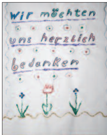
Das Deckblatt der Dankkarte.