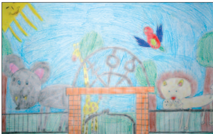
Das liebevoll gestaltete Bild schenkte Luisa dem „Lions Club“.