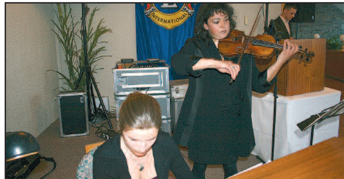
Umrahmt wurde die Feier mit musikalischen Werken von den Damen der Erzgebirgischen Theater- und Orchester GmbH.